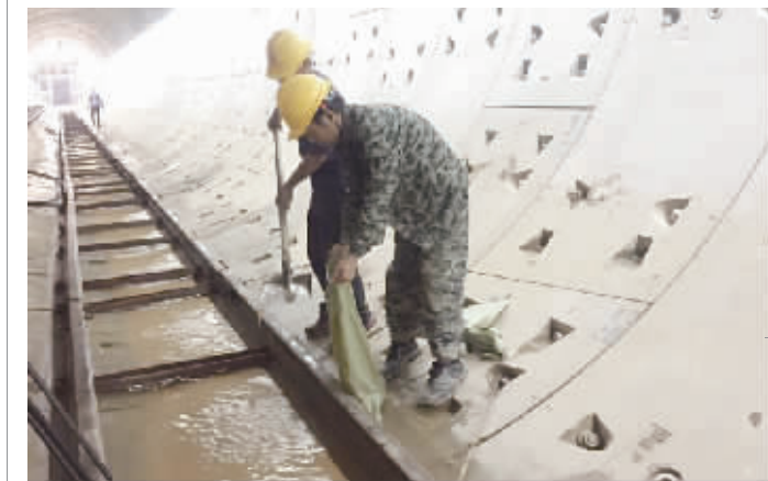
蔡塘站-中孚花园站盾构区间双线贯通。图为盾构机的后部配套部分。