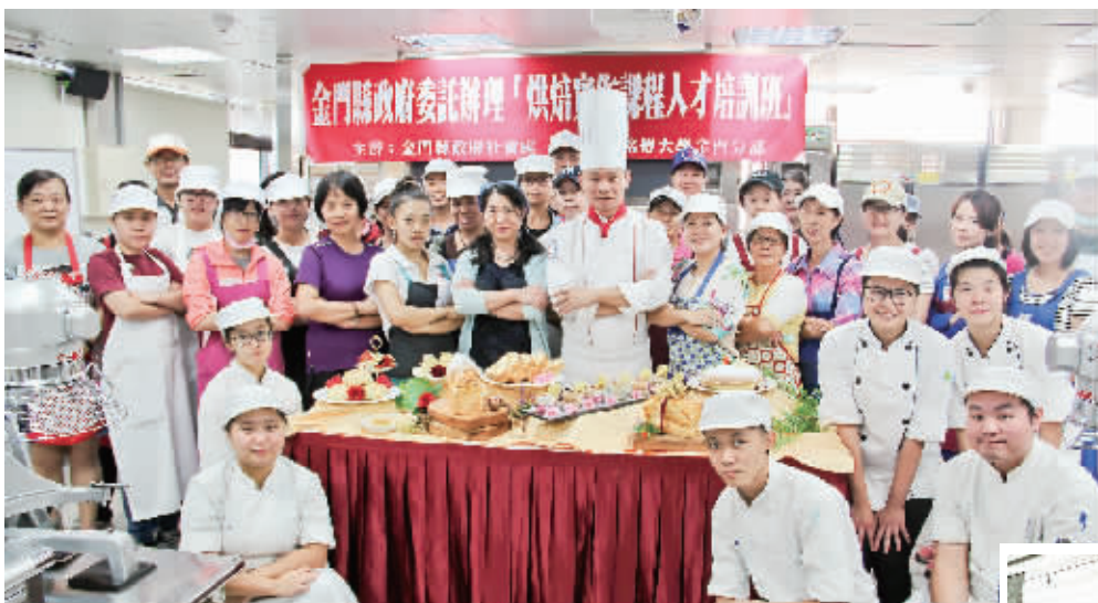
到台湾学习烘焙知识,体验“美食+文创”。

你将来到位于铭传大学金门校区“顶配”的专业烘焙教室,由台湾烘焙大师手把手教你15款经典西点:圆顶葡萄干土司、巧克力戚风蛋糕卷、柠檬布丁派、香草天使蛋糕、波士顿派、蔓越莓奶酪面包,还有最具台湾风味的“凤梨酥”……你会为自己亲手做出来的美食感到骄傲,还会获得铭传大学颁发的烘焙