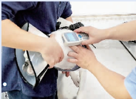
给狗注射微芯片后,工作人员扫码读取微芯片里的信息。