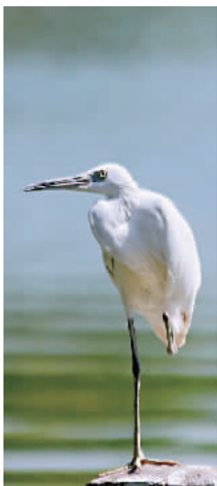
一条腿也站得很稳。 P18A073295