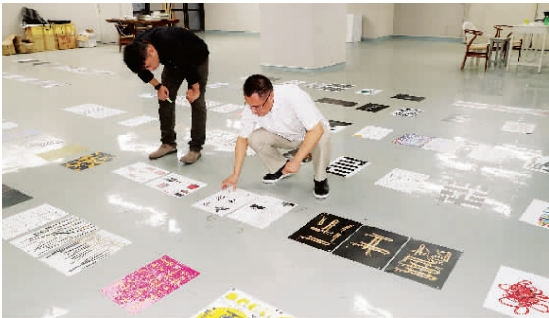
评委们正在评审作品。 P18A114645