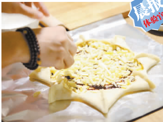
报名活动可亲手制作披萨。