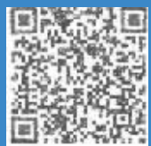
添加卢先生微信报名。