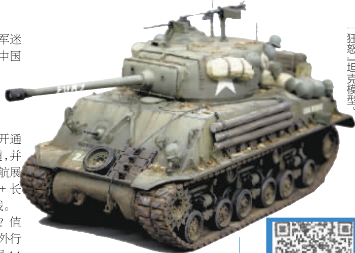
『狂怒』坦克模型。 1/35 谢尔曼 M4A3E8

活动由海西晨报社、海西晨报·ZAKER厦门、东南卫视《东南军情》、厦门报业国旅主办。S8A12050