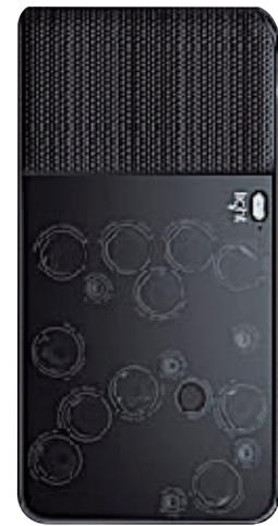
Light 16,一台拥有16个摄像头的相机。