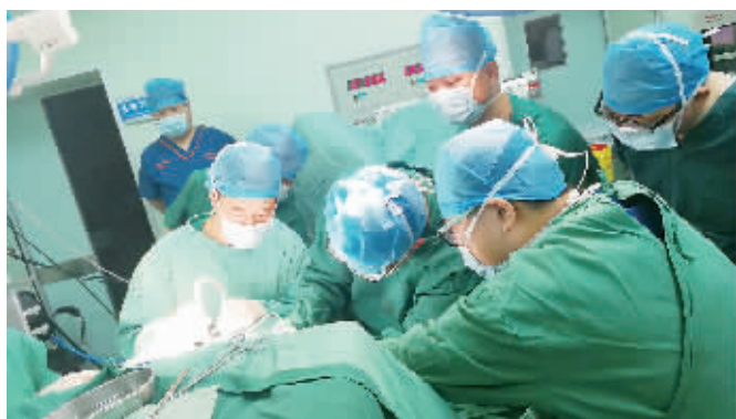
五院神经外科专家小心翼翼拆除小伙脑内“定时炸弹”。

“两个月来,我们全家与五院结下了深厚的感情,是五院给了孩子第二次生命。”患者的父亲告诉记者,在护理孩子期间,他突发肾绞痛,出于对五院医护人员的