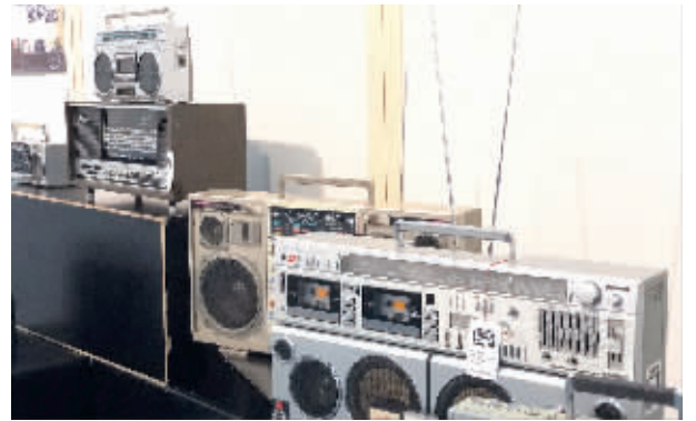
126件藏品见证了时代变迁。 P196124904