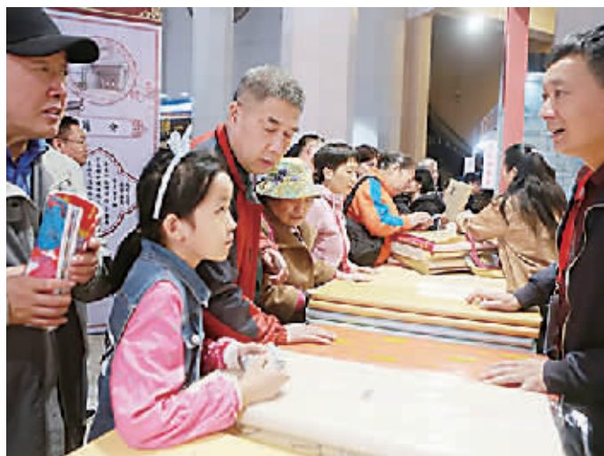
全国文房四宝艺术博览会汇聚来自各地的文房四宝精品、名品。(资料图)

据悉, 全国文房四宝艺术博览会由中国文房四宝协会主办, 创立于上世纪八九十年代, 从1995年第二届开始每年举行, 到2000年后, 分为“春季展”和“秋季展”每年举办两场。2019年3月在北京展览馆举办的春季展已经是第43届全国文房四宝艺博会, 展出面积17500平方米, 参展企业800余家。展会期间参观人数在10万人次以上, 贸易额上亿元。而此次秋季展则是首次在厦