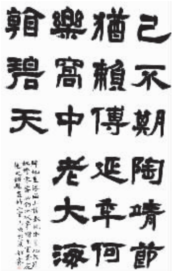
叶韶霖隶书作品《赵之谦诗二首》(局部)