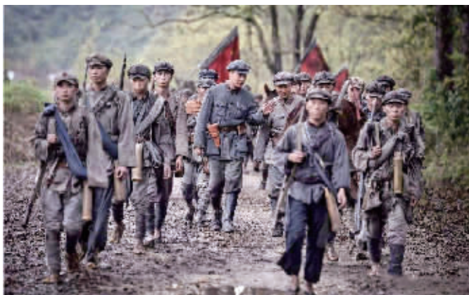
电视连续剧《绝命后卫师》剧照。

该剧荣获第十四届精神文明建设“五个一工程”(2014-2017)优秀作品奖、第31届中国电视剧飞天奖优秀电视剧奖、第29届中国电视金鹰奖优秀电视