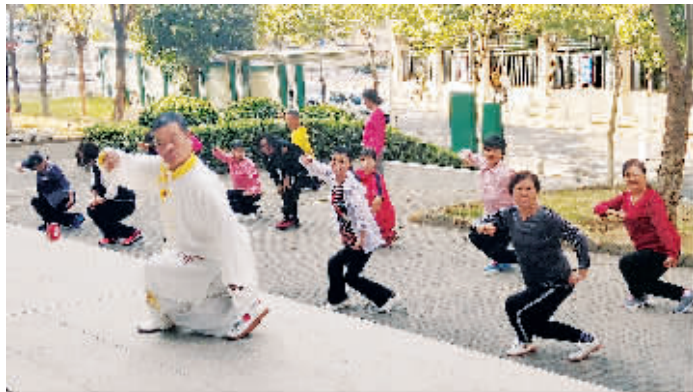
湖边社区老年朋友每天早上打拳晨练。 P19B177280

湖边社区文化活动中心建筑面积约1500平方米,设有老年健身辅导站、棋牌室、体育健身室、乒乓球、台球室等。下湖文化活动中心建筑面积约1800平方米,被打造成