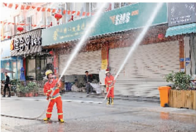
微站队员出水灭火。 P19B177319

非遗传承人。孩子们可以操控木偶舞红绸、舞狮子,并在运用传统技术的基础上,加入了现代表演元素。 S9B18056