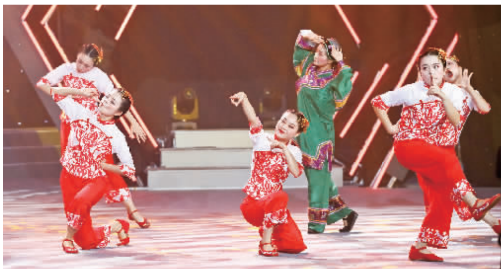
职工春晚节目海选总决赛上的舞蹈《欢喜俏婆媳》。 P19B177351

守护青山绿水、做好垃圾分类、开展扫黑除恶,现场还有许多节目契合了当下的主旋律。“食品安全抓在手,守护小岛保安宁。”快板舞蹈《扫黑除恶》讲述的是思明区市场监督管理局立足本职工作的故事,9名演出人员都是“扫黑除恶”的骨干力量,把食品安全、特种设备、质量监管等工作的点滴事迹,编写成快板。演出人员刘晓婧表示,演员们既要会打快板,还要会跳舞,排练难度