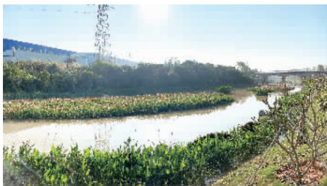
官浔溪高速公路桥至宋厝桥段安全生态水系水清岸绿。

据悉,作为同安区官浔溪高速公路桥至官浔溪水闸段安全生态水系建设工程的先行示范段,同安区官浔溪高速公路桥至宋厝桥段安全生态水系工程起点位于