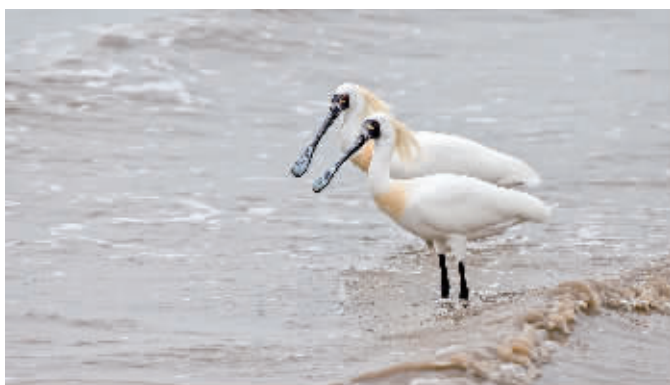
黑脸琵鹭在滩涂上觅食。

这两只黑脸琵鹭正处于繁殖期,头部、脖子有两撮浅褐色的繁殖羽,煞是好看。为了不打扰黑脸琵鹭,柯玉坤爬行了20多米,找到了最合适的拍照位置,并拍摄下几张珍贵的照片。当天下午退潮时,柯玉坤再次在滩涂上观测