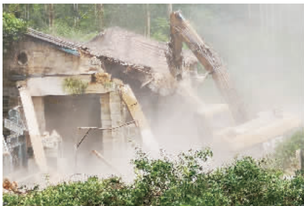
五显镇竹坝石垅水电站的退出拆除现场。

据五显镇相关负责人介绍,石垅水电站始建于1978年,投用于1979年,取水自竹坝石垅水库,装机容量200千瓦,厂房面积223.36平方米,发电供竹坝华侨农场使用。如今,水电站已完成了特殊的历史使命,为了溪流