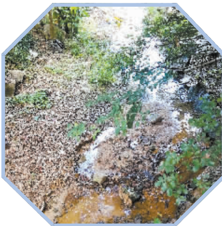
东坪山上状如水沟的小溪。