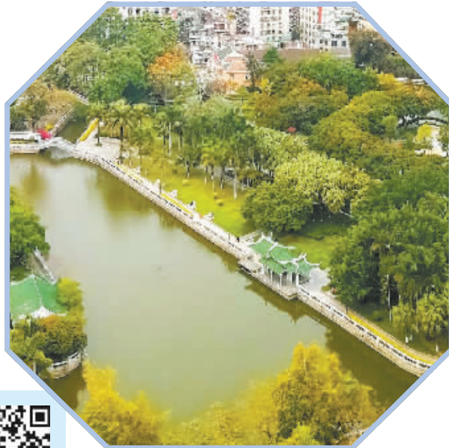
厦门将三条河贯通,成了现在的中山公园。 P206278325