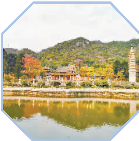
南普陀寺湖水。

知情人说,岛内主要的两个山脉,仙岳山无水,而东坪山上有少量溪流。特别是在夏日雨季之后,流水更为明显,这也部分印证了黄厝村民所言。