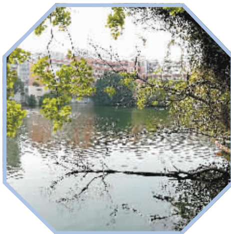
演武池。