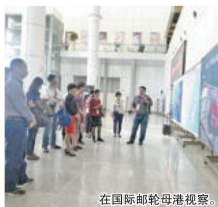
在国际邮轮母港视察。