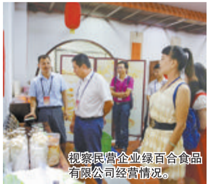
视察民营企业绿百合食品有限公司经营情况。