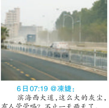
6日07:19 @凍婕:滨海西大道,这么大的灰尘,有人管管吗?不止一天两天了。

郁闷 6日9:21 骆先生来电: 集美中航城C期附近有个空地堆积了很多垃圾,已经连续快一个星期了,有人在那边焚烧,烟雾很大,又很刺鼻。我打了119跟110反映,昨天119就去了五趟,灭完,没多久又有人去点。天天这样也不是办法,每天晚上睡觉时都会被那味道臭醒。(周燕萍记录)