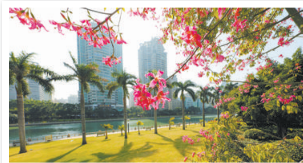
连日来厦门天气晴朗。图为昨日中午白鹭洲公园景观。(本报记者姚凡摄)