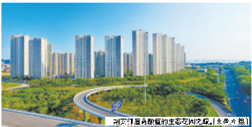
翔安打造高颜值生态花园之城。

这项工作,坚持党的领导、人民当家作主和依法治国的有机统一,巩固和发展生动活泼、安定团结的政治局面,汇聚民心民智民力,是关键所在。