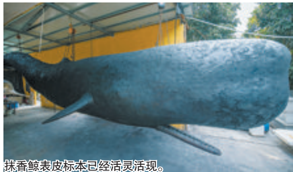
抹香鲸表皮标本已活灵活现。