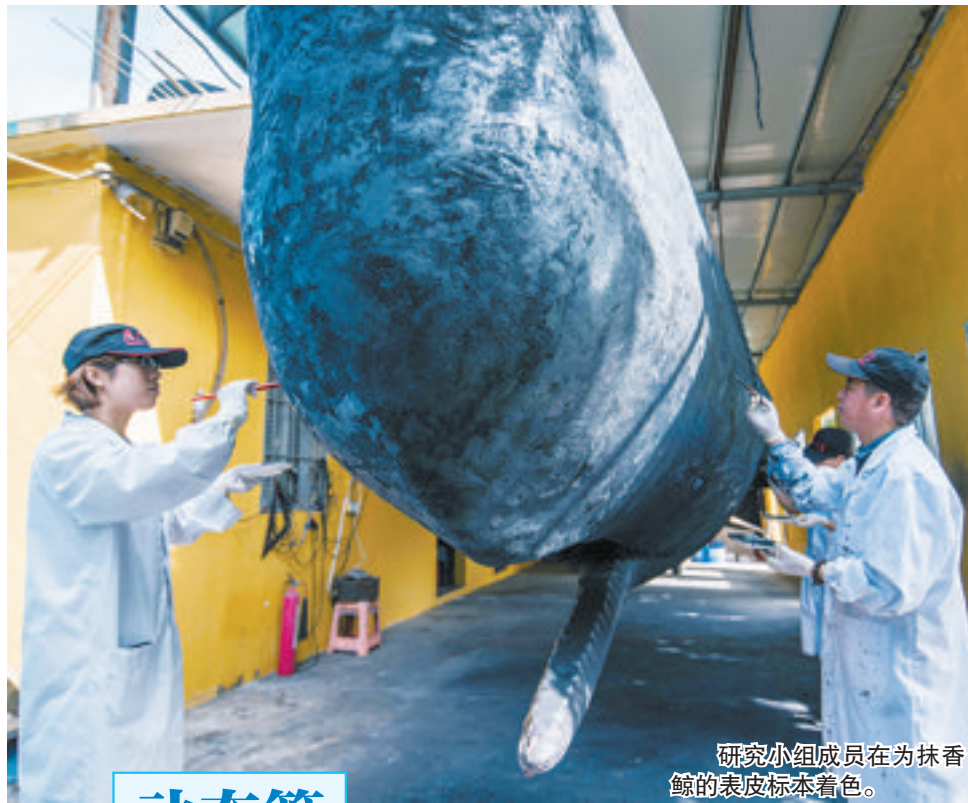
研究小组成员在为抹香鲸的表皮标本着色。

记者昨日还从惠州方面获悉,抹香鲸主题馆将设在新建成的惠州市渔业研究推广中心内。目前,主体工程目前已完工,正在紧锣密鼓开展布展设计,预计明年上半年建成,对外开放。