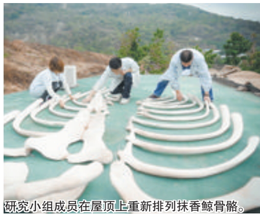
研究小组成员在屋顶上重新排列抹香鲸骨骼。