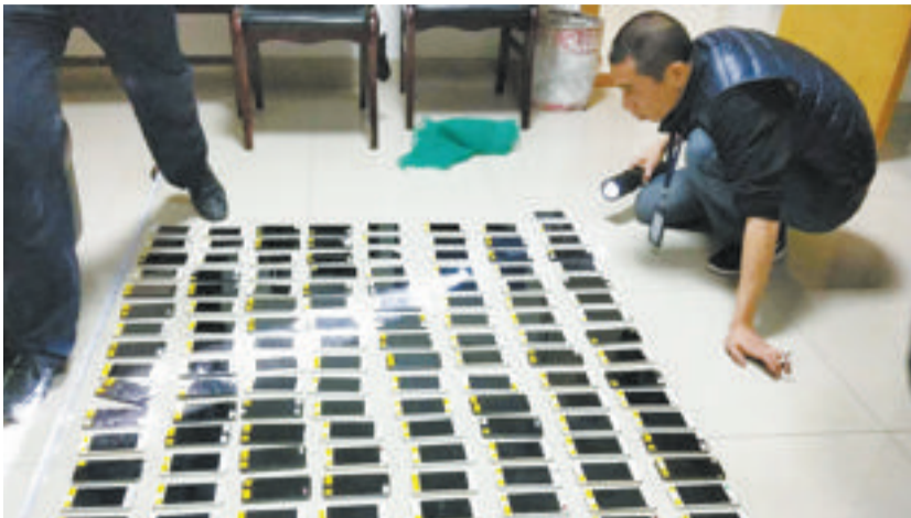
民警清点赃物手机。(图为赃物的一部分)