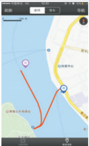
在轮渡码头打开“公厕查询”App,定位起点显示记者在北京。