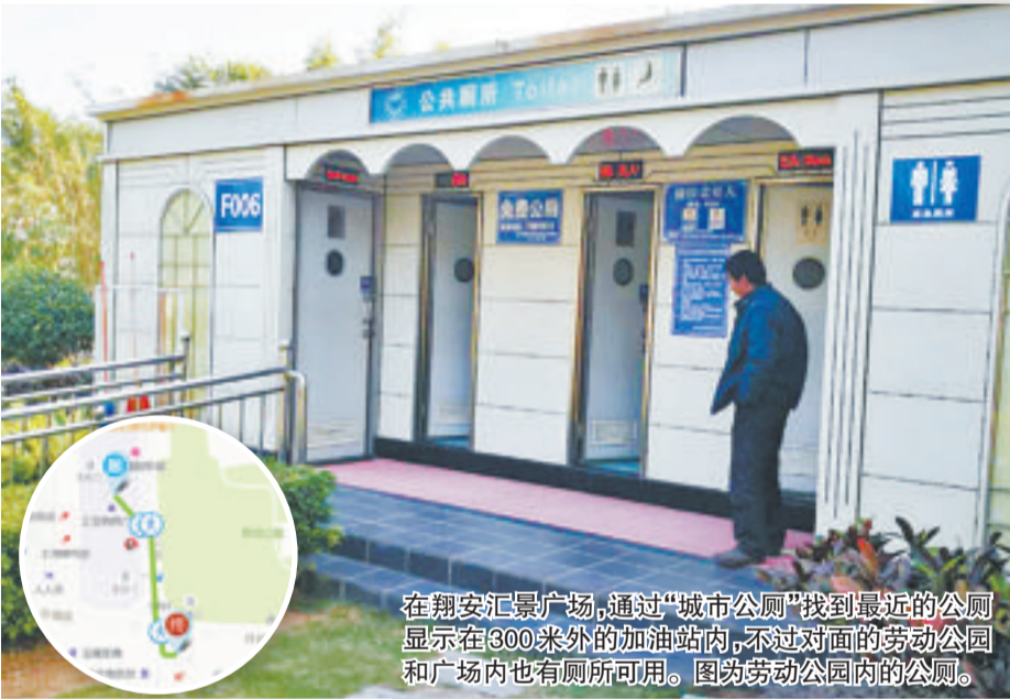
在翔安汇景广场,通过“城市公厕”找到最近的公厕显示在300米外的加油站,不过对面的劳动公园和广场内也有厕所可用。图为劳动公园内的公厕。