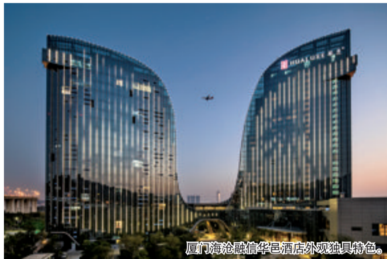
厦门海沧融信华邑酒店外观独具特色。

5月18日,华邑酒店及度假村全球第七家酒店——厦门海沧融信华邑酒店将盛大开业,标志着洲际酒店集团旗下专为中华商务精英及中华文化拥趸打造国际品牌豪华酒店正式进驻厦门市场。