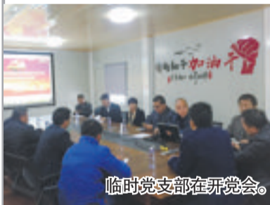
临时党支部在开会。

上周四,随着最后一段彩色沥青路面施工完成,备受关注的环东海域滨海旅游浪漫线一期工程核心段5.7公里彩色沥青路面完成全部铺设任务,项目建设又取得了一个重大阶段性胜利,也顺利完成了上级部门下达的计划任务目标。