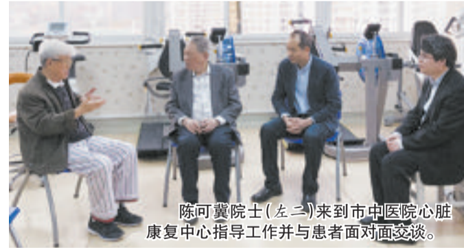
陈可冀院士(左三)来到市中医院心脏康复中心指导工作并与患者面对面交谈。

具体来说,运动训练,又称为运动康复,是心脏康复的核心疗法。王朝阳介绍,以往多认为冠心病、急性心肌梗死、支架术后及慢性心衰患者应尽量避免参加运动,限制体力活动,多休息,这种观念近年来逐渐改变,目前已有大量研究证实运动康复治疗能改善上述这些患者的运动耐力。康复训练可促使患者尽快康复,有效缩短住院时间及减少医疗费用,减轻患者精神及经济负担。而且,中医院心脏康复中心会根据每一个前来进行康复的患者具体情况,量身定制个性化运动康复方案,在每次的康复锻炼中,采用国际上公认最为精确的“心肺运动试验”为评估标准,使心血管病患者的运动既有精确的数字化,在保证安全的前提下,又最大程度地恢复患者的运动能力。当患者出院前,也会再制定一份运动“处方”,要求患者定期回访,确保康复运动能从医院延伸到家中,成为一个习惯而不是一个负担。