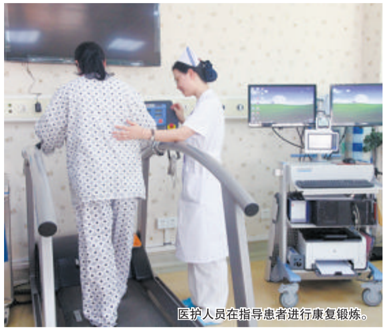
医护人员在指导患者进行康复锻炼。

北京中医药大学厦门医院(厦门市中医院)发挥中医药特色,打造心脏康复中心,对心脏病术后患者进行全面关爱服务