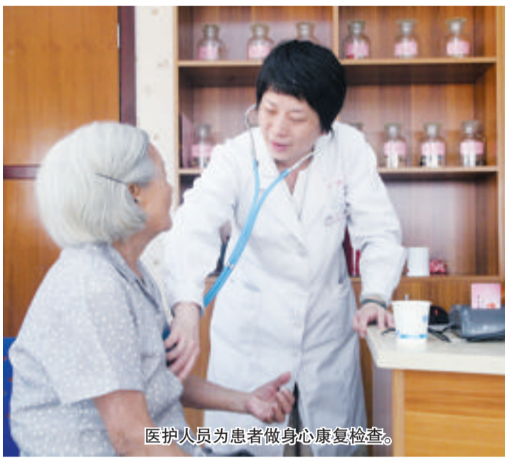
医护人员为患者做身心康复检查。

心血管疾病是我国慢病第一杀手。2017中国心血管病报告称,目前我国心血管病患者2.9亿。