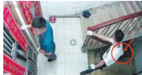
网传视频监控截图。

本报讯(文/图 记者房舒 通讯员 厦公宣)16日中午开始,一段视频在不少厦门网友之间传播,称该视频来自同安某小区监控,两名男子正在入室盗窃,而其中一人还疑似藏了一把砍刀。昨日,厦门警方经调查后表示,该网传消息不属实。