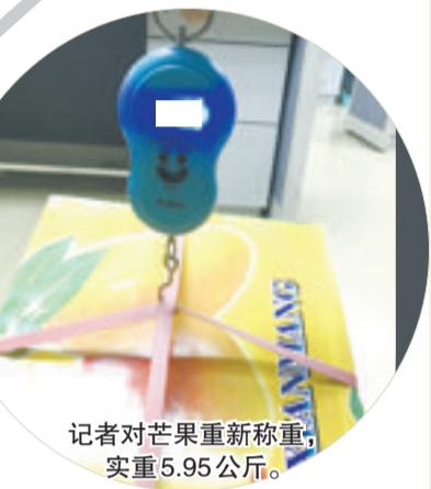
记者对芒果重新称重,实重5.95公斤。

当晚记者用电子秤重新称重,发现比店家称的少了1.25斤,总重仅为11.9斤。打开包装后记者发现:废纸下面竟还垫着上文所提的厚纸,废纸和厚纸加起来重1.94斤,纸箱重1.74斤,芒果净重仅8.22斤——如果按实际单价来算,每斤芒果为9.75元。也就是说,连箱子一起买,尽管才6元一斤,但在不缺斤短两的前提下,顾客实际要为纸箱和废纸付22元。