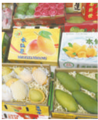
芒果箱里装着厚厚的碎纸。

而针对缺斤少两的现象,市场开办人员将在市场的一些路口放置公平秤,提示消费者保证自己的权益。消费者可以在购买后在公平秤秤,一旦发现重量不符可以找商家协商解决。