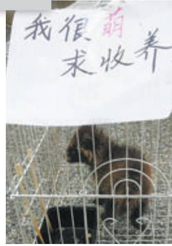
市民捡到被遗弃的浣熊幼崽。