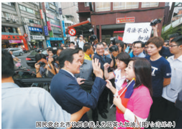
国民党台北市议员参选人向马英九加油。

本报讯 据台湾媒体报道,针对台湾“高等法院”逆转判马英九4个月徒刑一事,国民党主席吴敦义昨天下午在主持中常会前特别表示,“高院”逾越权责、径自否定台湾地区宪制性规定所赋予台湾地区领导人的职权,分明是有意羞辱前领导人,此一判决无法令人信服。吴敦义强调,全党上下强烈支持马英九提起上诉。