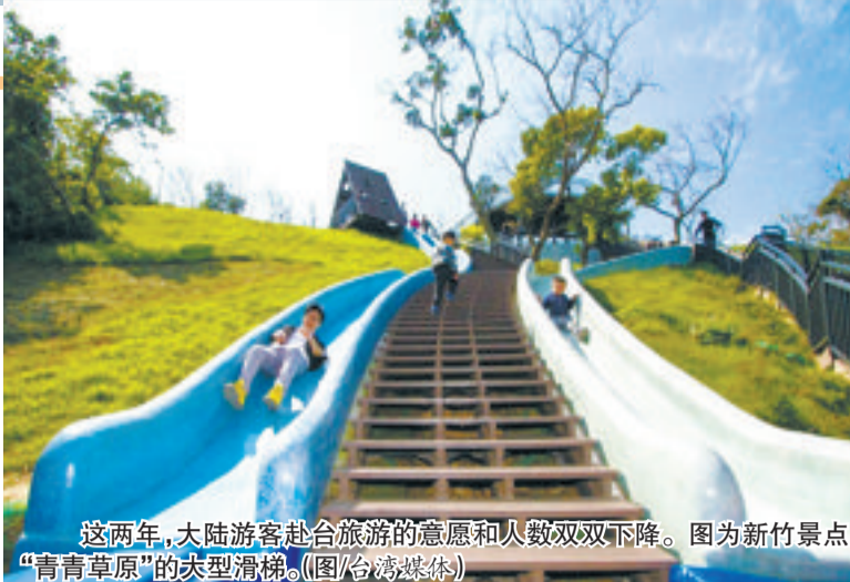
这两年,大陆游客赴台旅游的意愿和人数双双下降。图为新竹景点“青青草原”的大型滑梯。

据新华社电 国务院台湾事务办公室16日上午举行例行新闻发布会,新闻发言人安峰山就近期两岸热点问题回答记者提问。发言人警告“台独”分子,凡走过必留痕迹。他说,赖清德的“台独”言论进一步对台湾的和平稳定进行了公然挑衅,所以当前两岸关系倒退的责任完全是在台湾当局。会有越来越多的台湾同胞慢慢觉醒,能够跟大陆同胞一道,共同去推进两岸的交流合作和两岸关系的和平发展。