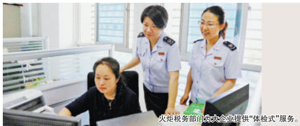
火炬税务部门为大企业提供“体检式”服务。