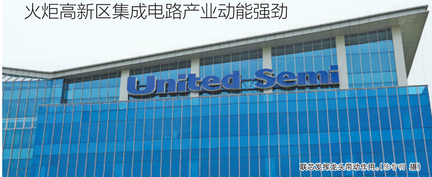
联芯发挥龙头带动作用。

近年来,厦门市委、市政府高度重视并大力支持集成电路产业,出台《厦门市集成电路产业发展规划纲要》《厦门市加快集成电路产业实施意见》《厦门市加快集成电路产业实施细则》等,从顶层设计到具体推动环节各个层面精准发力。事实上,从厦门联芯成为我国大陆地区已投产的技术水平最先进、良率最高的12英寸晶圆厂,到云知声研发的全球首款面向物联网的AI(人工智能)芯片将在厦门量产,今年以来,火炬高新区的“中国芯”发展成绩频频上“红单”。