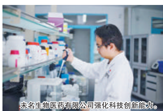
未名生物医药有限公司强化科技创新能力。

近日,由国家市场监督管理总局指导,经济日报社、中国国际贸易促进委员会、中国品牌建设促进会主办的“2018中国品牌价值评价信息发布”活动在上海举行,我省有59个品牌进入上5亿元榜单。其中,高新区企业未名生物医药有限公司、厦门南讯软件科技有限公司分别位于第13位和第88位。