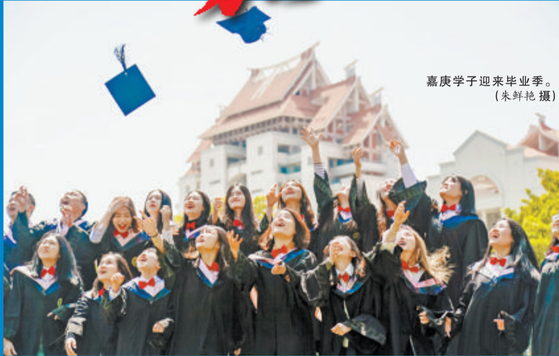
嘉庚学子迎来毕业季。

本周日9:30-15:30,厦门大学嘉庚学院将举行校园开放日,面向高考考生和家长们开放,它位于厦大漳州校区。