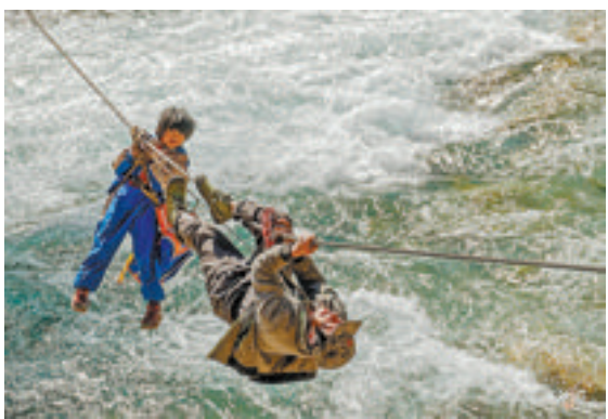
颜筱依的摄影作品《上学路上》。