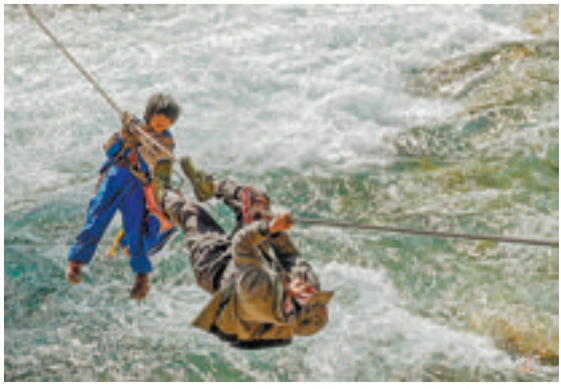
颜筱依的摄影作品《上学路上》。