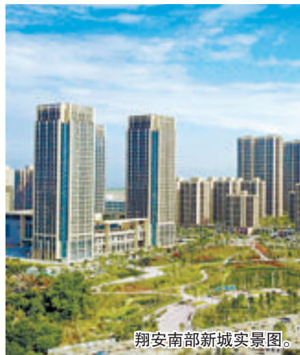
翔安南部新城实景图。

在众多的新兴区域中,翔安南部新城名气最大,除了高价地扎堆外,未来超大的供应体量也是重要看点之一。