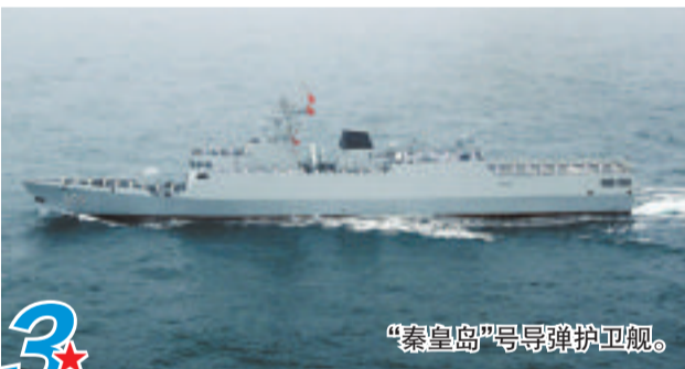
“秦皇岛”号导弹护卫舰。

贵阳舰:“贵阳”号导弹驱逐舰作为现代化防空驱逐舰,既被称为“带刀护卫”又被称为“中华神盾”。未来,新入列的贵阳舰也将迅速形成战斗力,与其它舰艇组成编队驰骋远海大洋。