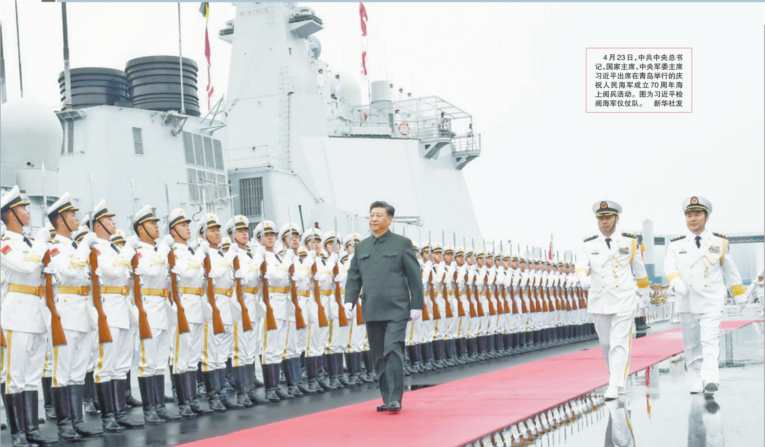
4月23日,中共中央总书记、国家主席、中央军委主席习近平出席在青岛举行的庆祝人民海军成立70周年海上阅兵活动。图为习近平检阅海军仪仗队。