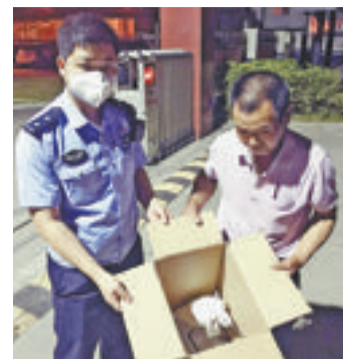
民警帮受伤白鹭包扎,并找来一个消毒过的纸箱暂时安放。

本报讯(文/图记者 薛尧 通讯员 张翔 刘淮钦)受伤白鹭飞到市民家“寻求帮助”,热心市民第一时间报警。昨日,记者从集美警方了解到,马銮湾派出所民警和热心市民一起,成功救助了一只国家二级重点保护动物白鹭。