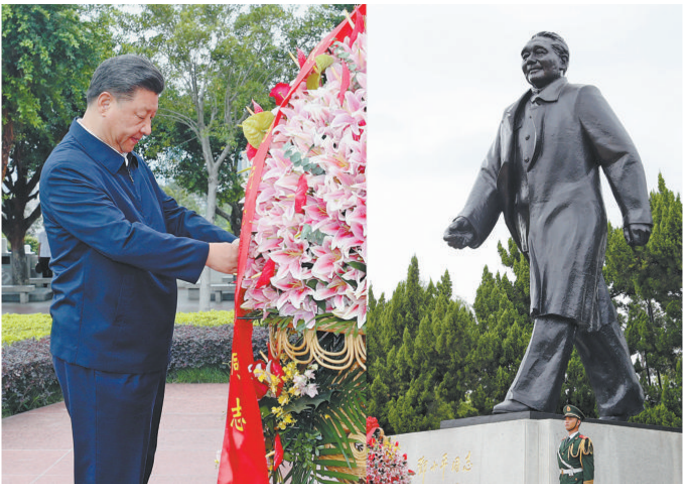
习近平昨日来到莲花山公园,向邓小平同志铜像敬献花篮。