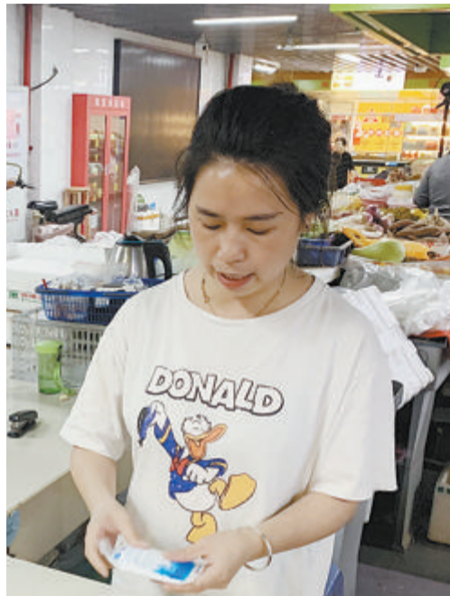
商家在配送生鲜时,使用冰袋保鲜。

文/图 本报记者 张玉榕 见习记者 蒙靖 “这些冰袋,该怎么处理,如何垃圾分类?”秋食大闸蟹正当时,可近日,不少市民享用完美食后发出这样的疑问。与此同时,“网购生鲜冰袋处理成难题”这一话题,近期引发网友热议。 冰袋里到底是什么成分,有没有毒?垃圾分类时,冰袋该放进哪一个桶?针对这些问题,本报记者联系材料学和垃圾分类领域的专家学者与权威部门解惑。