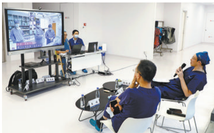
▲两岸心血管病专家实时交流点评手术直播。

此届海峡会上,厦心带来了一例高难度TAVI手术直播演示。一名70岁的老大爷因为心脏“阀门”——主动脉瓣重度狭窄并中度关闭不全,而多年饱受胸闷、气促的折磨。面对如此高龄高危的患者,传统的外科开胸手术患者已无法耐受,厦心团队迎难而上,为其施行了TAVI手术,且术中还采用了新近上市的主动脉瓣材料(S3),为国内首次在实时手术直播中应用,微创不开胸就为老人家更换了心脏瓣膜,获得了与会专家们的高度肯定。目前,厦心在这一领域屡屡取得突破性进展,让越来越多不同类型的高危主动脉瓣重度狭窄患者也能享受到微创手术。