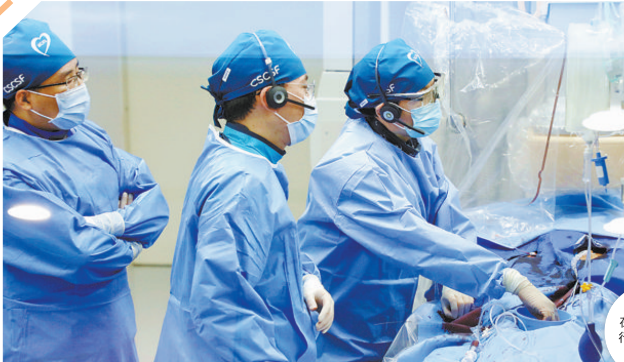
厦心专家在大会上跨海手术直播演示。