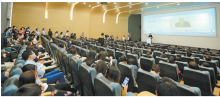
▲第十一届海峡心血管病高峰论坛在厦举办。

此外,作为第三届“中国最美医院”之一,厦心五缘湾现址极具国际化的人文设计和高效便捷的管理流程也给与会者留下了深刻印象。海峡两岸医药卫生交流协会会长王立基在开幕式上感叹,参观厦心后,深刻地感受到医院所有设计都是以患者诊疗为中心出发的,厦心精湛的医疗技术水平更是让老百姓真正享受到改革开放的医疗红利。