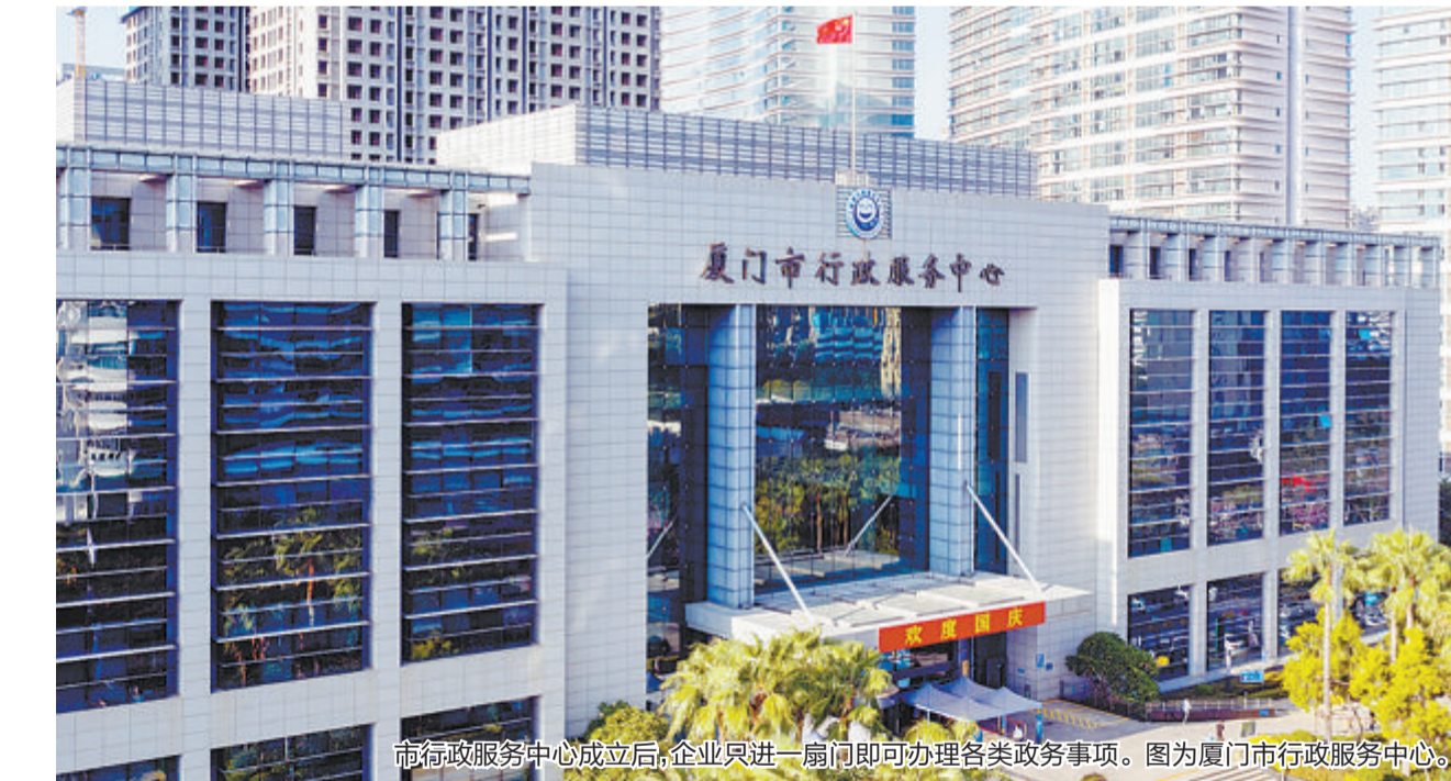
市行政服务中心成立后,企业只进一扇门即可办理各类政务事项。图为厦门市行政服务中心。

立足先行先试,我市持续深化商事登记制度改革,推行开办企业“一件事一次办”“免费刻章”“零成本、零跑动”。企业开办时限从2012年的十多个工作日压缩至1个工作日内,其中设立登记办理时限跑出0.5天的“厦门速度”,企业开办全程网办率达87.3%。营商环境的持续改善提升,激发了经营主体的