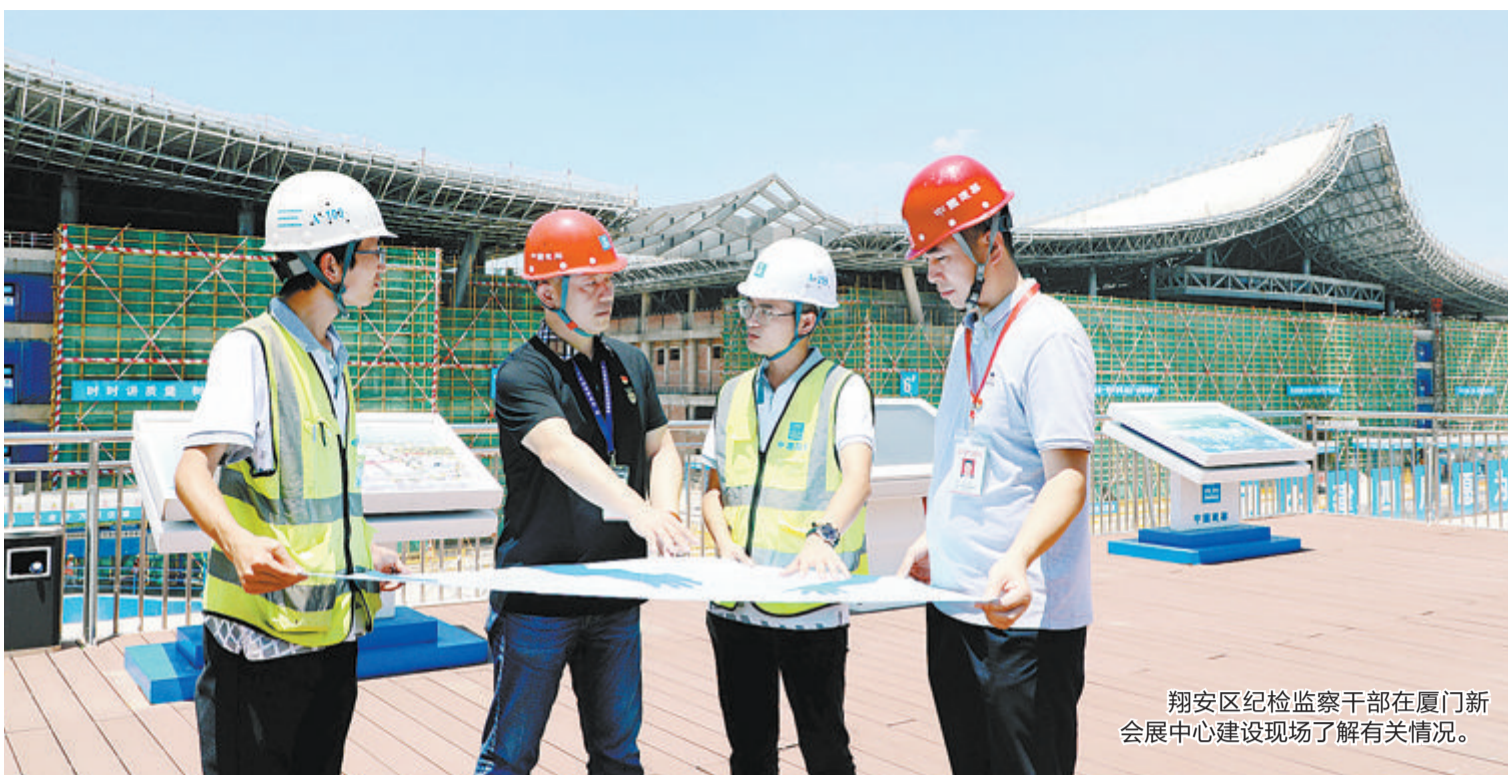
翔安区纪检监察干部在厦门新会展中心建设现场了解有关情况。

一组数据彰显工作成效:“1+2+4+N”联动监督机制实施以来,共发现问题33个,已推动解决23个,发出监察建议3份,为省市重点项目建设提供坚强保障。