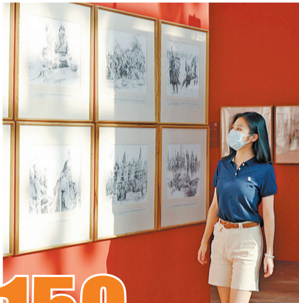
市民前往现场观展。