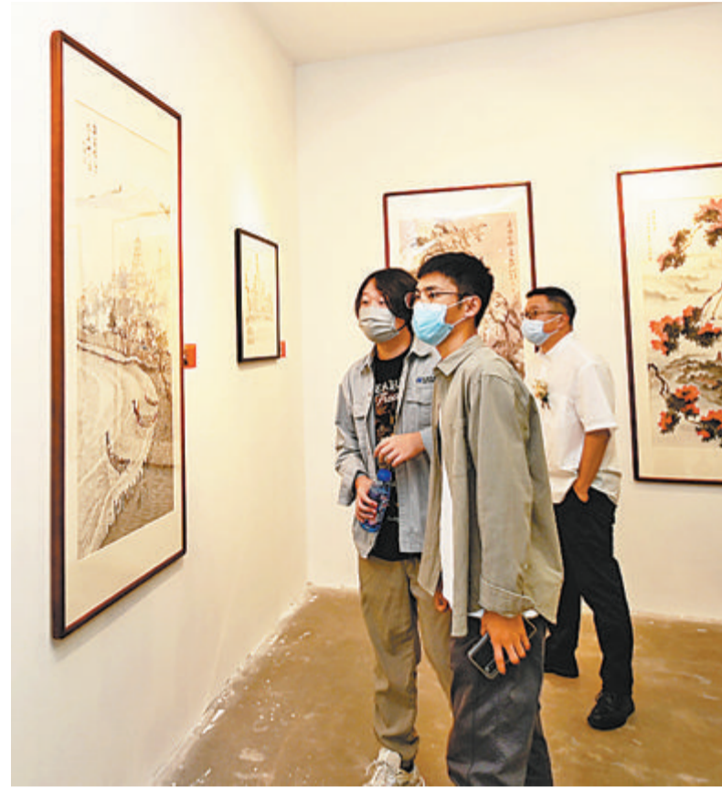
市民正在观展。