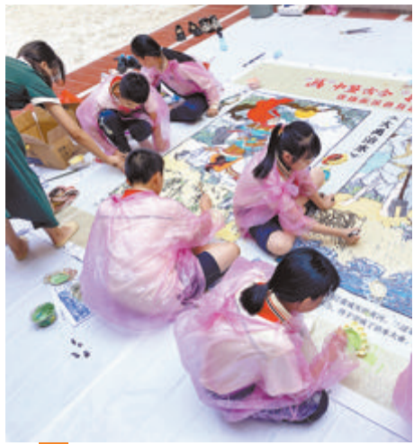
主办方针对少儿读者同步开展线下连环画涂色互动活动。