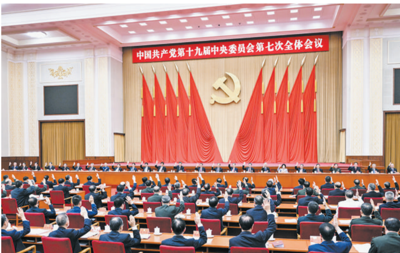
中央政治局主持会议。

新华社北京10月12日电 中国共产党第十九届中央委员会第七次全体会议公报(2022年10月12日中国共产党第十九届中央委员会第七次全体会议通过)