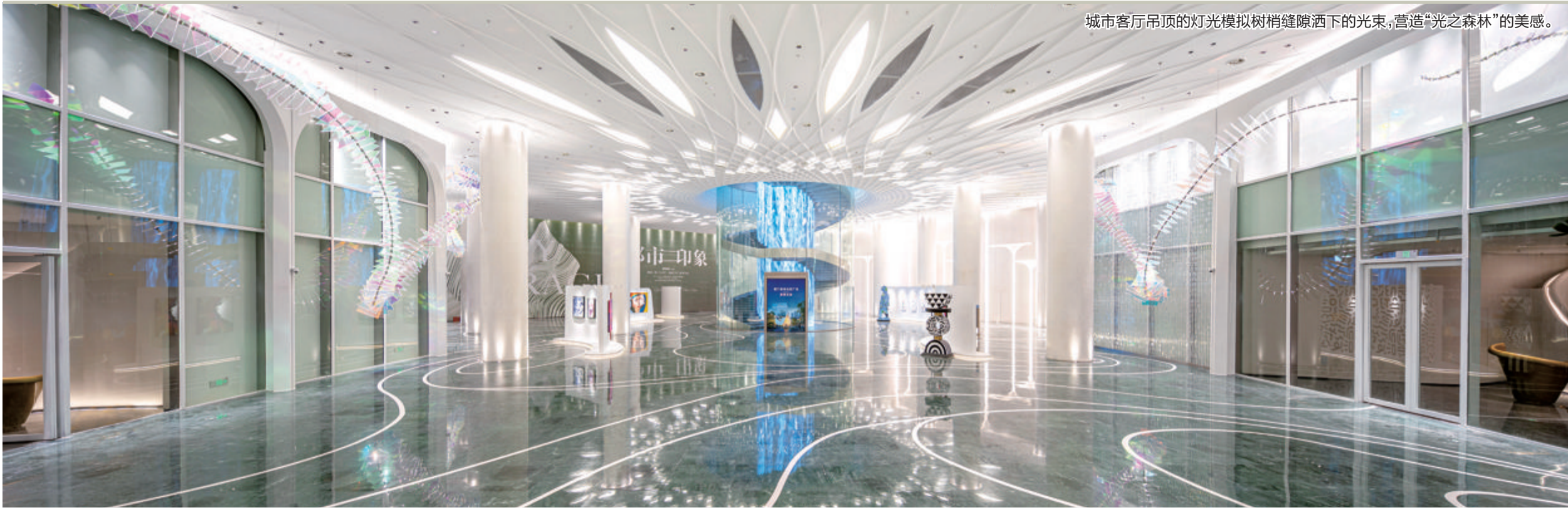
城市客厅吊顶的灯光模拟树梢缝隙洒下的光束,营造“光之森林”的美感。