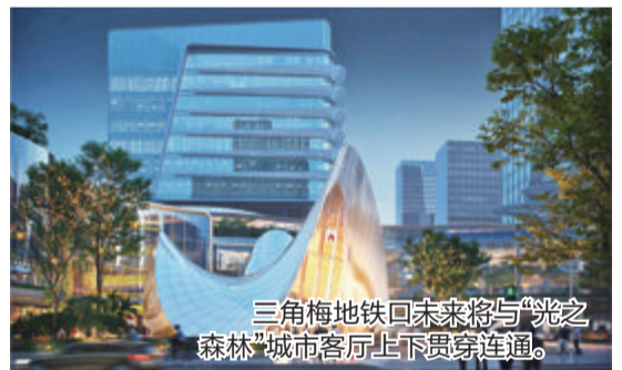
三角梅地铁口未来将与“光之森林”城市客厅上下贯穿连通。

“卢浮宫新馆在前广场上建玻璃‘金字塔’的初衷,在于将其地下与轨道交通进行连接并通往旧馆入口,所以当新入口建成后,可以同时吸纳地面的客流和地铁的客流。三角梅地铁口的建造理念与之不谋而合。”毛咏雯认为,致敬经典更好的方式,就是用更好的体验连接现代的公共交通,让更多的人进入到城市文化地标和艺术殿堂。