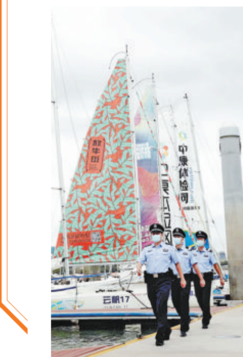
▲民警在辖区帆船靠泊区巡逻。