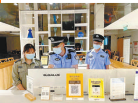
▲国庆期间,民警对辖区民宿进行安全检查。