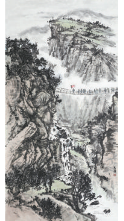
▲国画《万水千山只等闲》。作者:高葆

画、诗词、篆刻、集邮等作品,充分展现厦门公安朝气蓬勃、昂扬向上的精神风貌,现选登部分优秀作品。(厦宣)