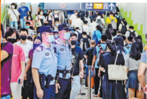
▲出行高峰期民警在地铁站内安保。

车水马龙间,民警指挥车辆有序通行;热门景区内,警灯闪烁护民安;街头巷陌里,民警贴心服务解民忧。在每一个合家团聚的日子里,厦门公安值守在鹭岛的大街小巷,为建设平安厦门保驾护航,以实际行动守护人民群众幸福安康。