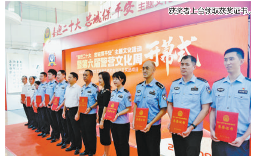
获奖者上台领取获奖证书。

市公安局举行“喜迎二十大 忠诚保平安”主题文化活动,征集作品数量、质量创历年最高