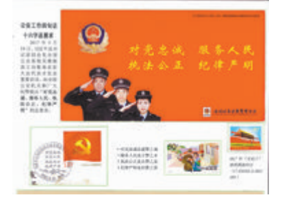
▲集邮作品。作者:蓝伟