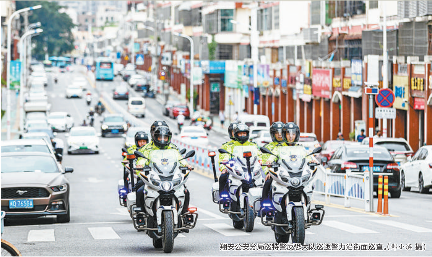
翔安公安分局巡特警反恐大队巡逻警力沿街面巡查。