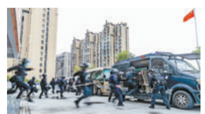
▲摄影《紧急拉动》。作者:郑小滨