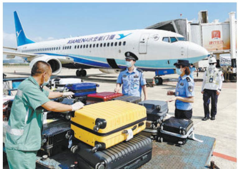
▲民警在航空控制区进行空防安全检查。

市公安局重视提高全民反诈防骗意识,除了推出入户、入企、入校、入群、入场所的“心防五入”宣传活动外,还积极调动社区工作者、网格员参与反诈工作,在社区、乡村、企业、高校等建立反诈宣防志愿者队伍,依靠基层群团组织、覆盖一线基本单元的防控体系,实现全警反诈、全社会反诈,守护群众“钱袋子”。