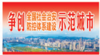
文/通讯员 张露悦

市公安局创新打造“3+1”社会面巡防体系,形成反诈精准宣防新模式,科技赋能开展“海陆空联动”救援行动,着力提升群众安全感