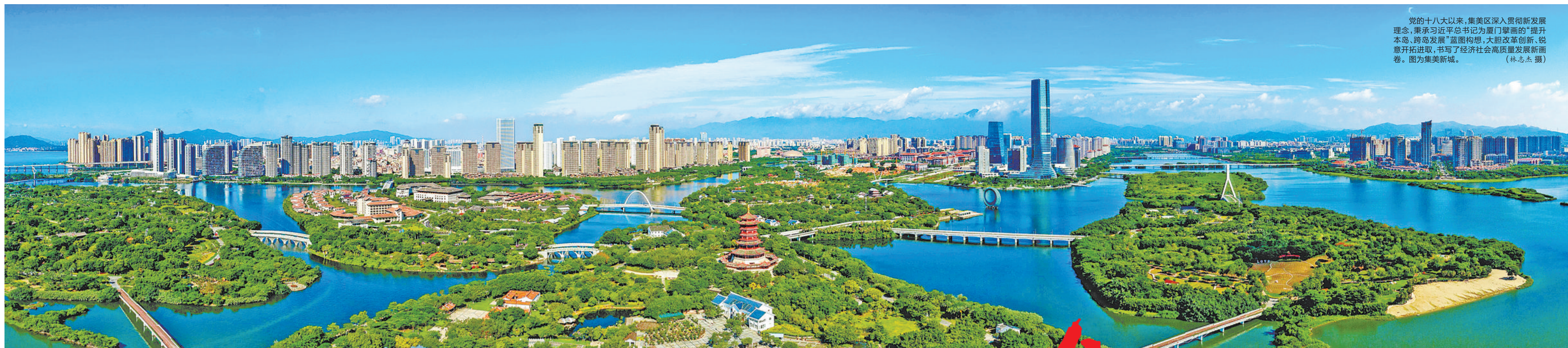
党的十八大以来,集美区深入贯彻新发展理念,秉承习近平总书记为厦门擘画的“提升本岛、跨岛发展”蓝图构想,大胆改革创新、锐意开拓进取,书写了经济社会高质量发展新画卷。图为集美新城。