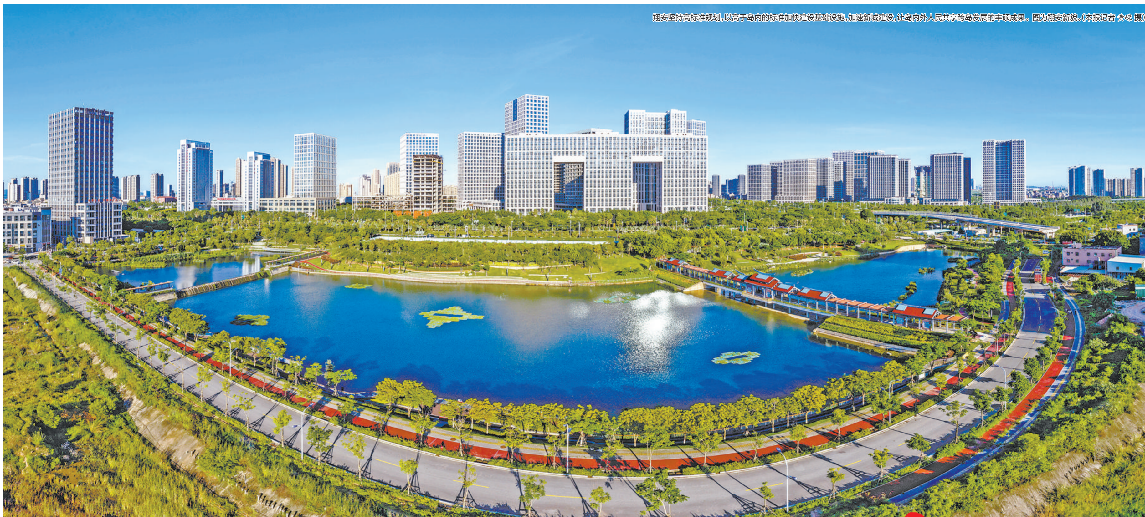
翔安坚持高标准规划，以高于岛内的标准加快建设基础设施，加速新城建设，让岛内外人民共享跨岛发展的丰硕成果。图为翔安新貌。

10年来，一批批翔安建设者，以“一张蓝图绘到底”的责任自觉，以“功成不必在我”的博大胸襟，以“功成必定有我”的历史使命，聚焦“五个翔安”建设，坚持产城人融合，跑出了新区建设的加速度，书写了新时代翔安发展的新赞曲。