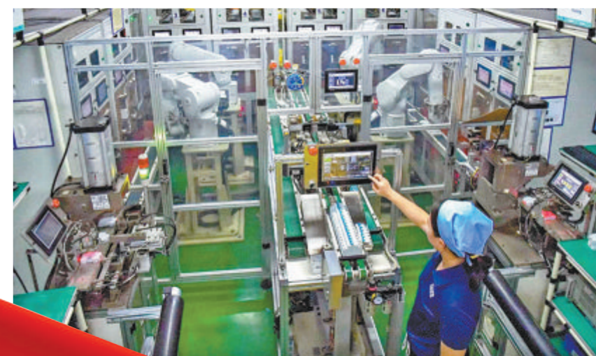
▲产业兴，百业旺。海沧积极融入国家产业战略，生物医药、集成电路、新材料三大主导产业齐头并进。