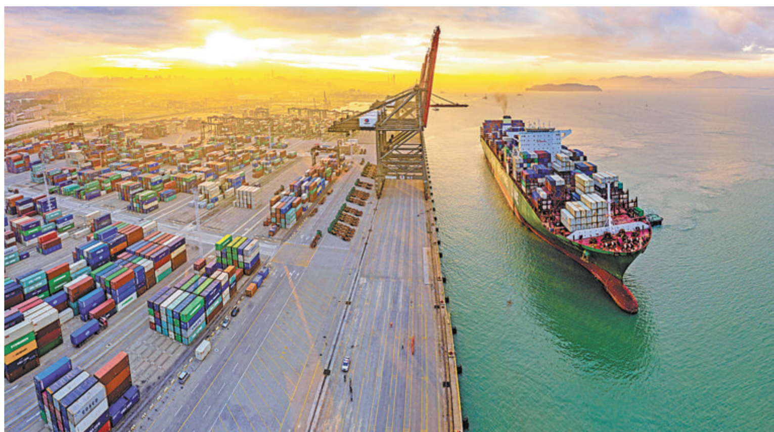
▲海沧港区集装箱吞吐量占厦门港超七成，占福建半壁江山。

勇立潮头，看海沧！海沧，正以“创先争优、走在前列”的劲头奋力拼搏，一手抓发展热度，一手抓民生温度，努力在更高起点上建设高素质高颜值国际一流湾区，让人民幸福、更幸福！