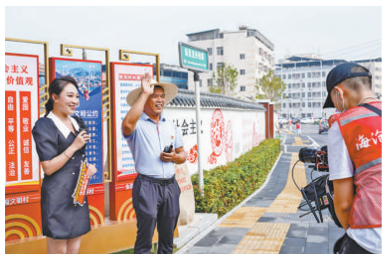
▼乡村振兴加速推进，海沧农村人均可支配收入连续16年全省第一。