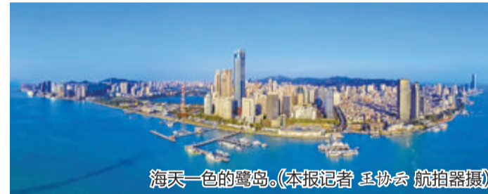
海天一色的鹭岛。

近年来，我市经济社会高速发展，建设用地供需矛盾较为突出，在保障发展的同时坚持土地节约集约利用显得尤为重要。为此，市资源规划局在优化资源配置、节约集约用地、释放供给活力等方面频频发力。