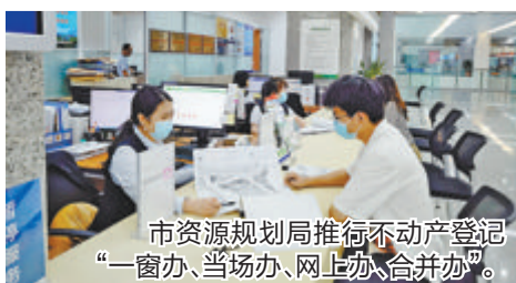
市资源规划局推行不动产登记“一窗办、当场办、网上办、合并办”。

聚焦社会关切，以改革创新为动力，市资源规划局率先推行不动产登记“一窗办、当场办、网上办、合并办”等一批首创新性、引领性的改革举措，全力打造登记财产“厦门蓝本”。同时，充分利用信息化建设的先发优势，通过整合电子政务应用成果，推行零人工、零耗时、零跑动“三个零”的无感登记，实现抵押登记、国有建设用地使用权及房屋所有权转移登记等高频业务的“申请即办结”。