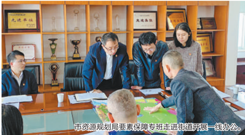
市资源规划局要素保障专班走进街道开展一线办公。

值得一提的是，近年来市资源规划局还不断探索具有厦门特色的详细规划体系，构建“全域全要素覆盖、全生命周期、全时空传导”的详规架构，将详细规划延伸到岛外的每个角落。通过城镇开发边界内的控制性详细规划和开发边界外的乡村单元规划、村庄规划，落实岛内外“一盘棋”的规划理念，有效促进岛内外一体化发展。