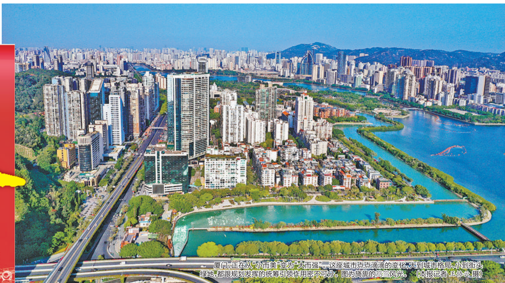
厦门，正在从“小而美”变为“大而强”。这座城市点点滴滴的变化，大到城市格局、小到街头绿地，都跟规划发挥的统筹引领作用密不可分。图为施施的鹭岛风光。

本版文/本报记者 袁舒琪 通讯员 刘一鸣 杨臻