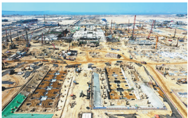
▲今年1月4日,厦门翔安机场项目全面开工。

国最优的快速公交系统,社区公交、定制公交、村村通公交覆盖城乡各个角落;以网约车为代表的出租车行业快速发展,合规率位居全国前列,打造网约车规范管理的全国标杆城市;建成大交通信息共享服务平台,推进智慧交通科技示范工程建设,大力推行“互联网+”政务服务;交通执法刚柔并济,在全省率先建设智慧眼执法系统、卡口分析系统,执法规范化水平在全省领先,公示、全过程记录和法制审核“三项制度”走在全国前列;厦门公路以交通强国试点城市建设为契机,全力建设平安优先、路况优良、管理优化、生态优美、服务优质的“五优公路”。 党的十八大以来,厦门交通坚持以深化“四好农村路”高质量发展为抓手,完成新改建农村公路超过450公里,实现村村通公交,并开通13条“公交快速融合”线路,逐步提升厦门农村地区交通基础设施服务水平。