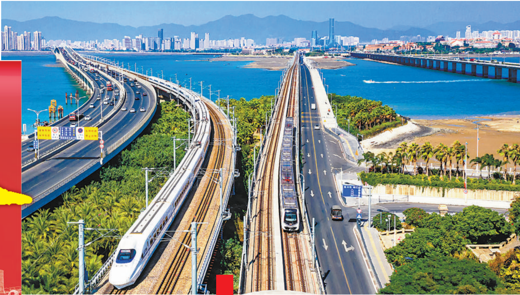
厦门已初步建成以铁路、高速公路为主骨架,海港、空港、陆港为主枢纽,多种运输方式协调发展的现代化综合交通运输体系。图为和谐号动车与地铁1号线同框。