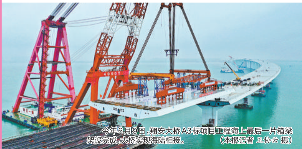
今年6月9日,翔安大桥A3标项目工程海上最后一块箱梁架梁完成,大桥实现海陆相接。