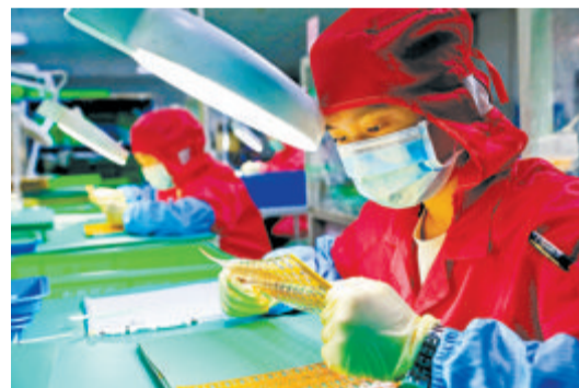
▲“三高”企业瑞华高科车间,工人在认真检查医疗电路板。(资料图)

本报讯(记者 林雯)日前,思明区科技和信息化局就《思明区先进制造业倍增计划实施方案(2022—2026年)》(以下简称《方案》)公开征求意见,时间截至11月19日。