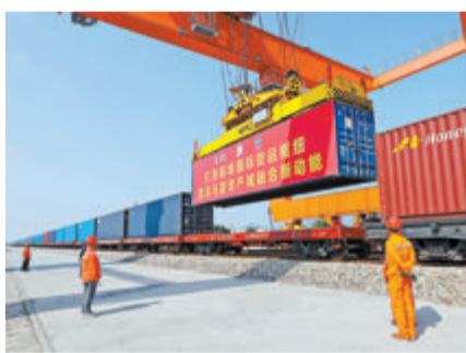
▲昨日,满载“中国制造”产品的集装箱装车。

作为厦门五大物流产业聚集区之一的核心园区,前场铁路大型货场、前场物流园区积极实践“大通道、大物流、多功能、高水平、高质量”发展理念,着力发挥货运枢纽和多式联运功能,打造“中欧班列海铁联运核心枢纽”。同时,重点发展基于物流服务的采购贸易、物流分拨、供应链金融、区域运营结算总部等“四位一体”业务,致力成为全国标杆物流产业聚集区,助力马銮湾新城实现产城融合高质量发展。