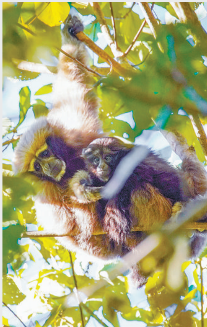
在云南德宏拍摄的天行长臂猿母子。

10月24日是国际长臂猿日。长臂猿是仅次于人类的高级灵长类动物,是我国仅有的现生类人猿。目前全世界共有16种长臂猿,全部分布在亚洲。我国目前共有7种长臂猿,均为国家一级保护动物。虽然近年来通过各种保护措施数量有所增加,但总体来说,我国长臂猿的情况依然不容乐观。