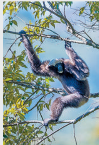
成年雄性天行长臂猿为黑色。