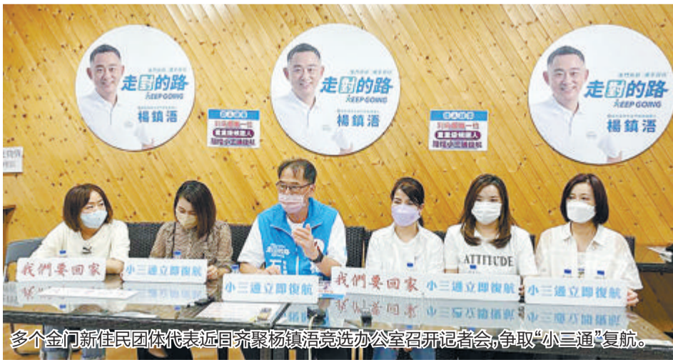
多个金门新佳民团体代表近日齐聚杨镇酒选办公室召开记者会,争取“小三通”复航。

据人民网报道 “小三通”因新冠肺炎疫情停摆近3年,重创金门各行各业。是否重启“小三通”,成为这次金门县长选战的焦点。金门民众反应强烈,近日呼吁台当局赶快恢复“小三通”。