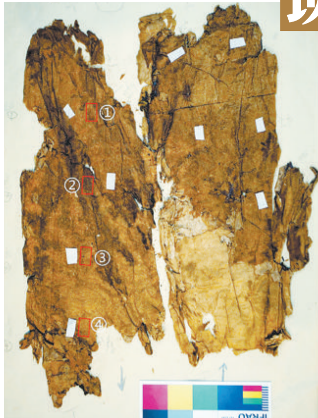
马王堆三号墓出土的菱纹绮丝绵袍上织有如、意、长、寿字样。