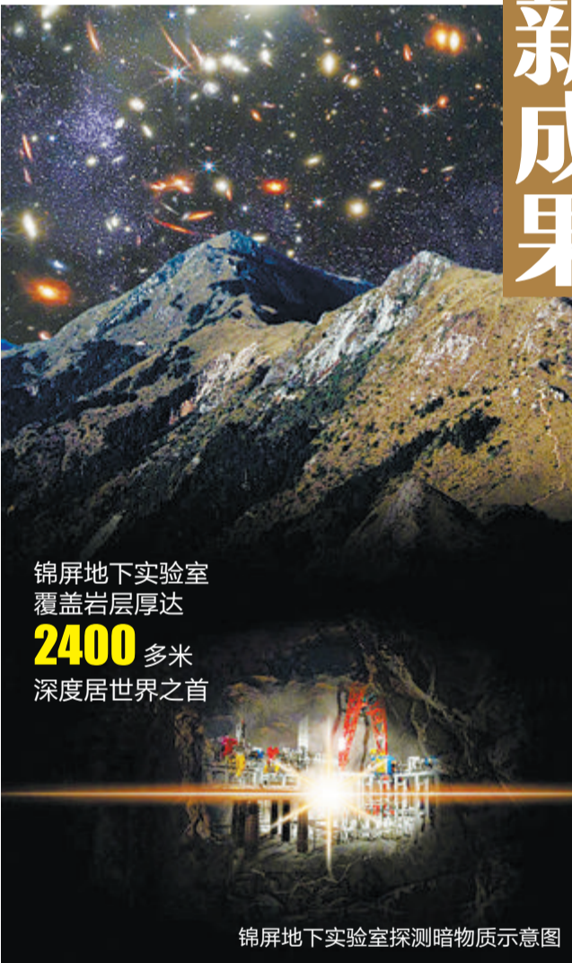
锦屏地下实验室 覆盖岩层厚达2400多米 深度居世界之首

漆器以及织绣精美的丝织衣物等珍贵文物，是20世纪我国最重要的考古发现之一。为研究汉代初期埋葬制度、手工业和科技的发展及长沙国的历史、文化和社会生活等方面提供了重要资料。据中新网