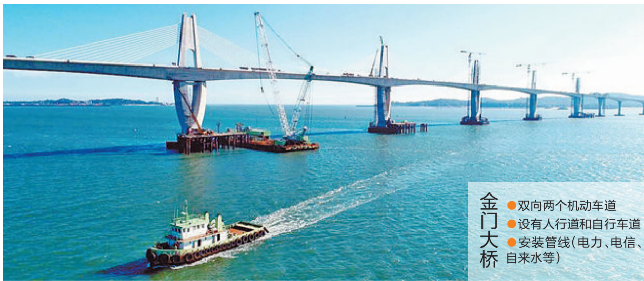
金门大桥 双向两个机动车道 设有人行道和自行车道 安装管线(电力、电信、自来水等)

据中新网报道 金门大桥近日办理通车勘验。台“高速公路局”表示，定于10月30日(周日)正式开放通车。