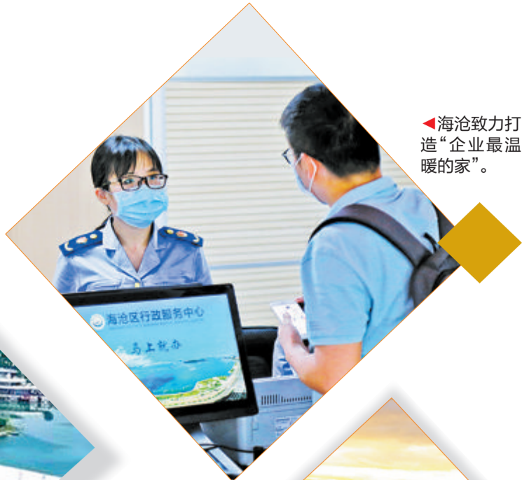
▶海沧致力打造“企业最温暖的家”。