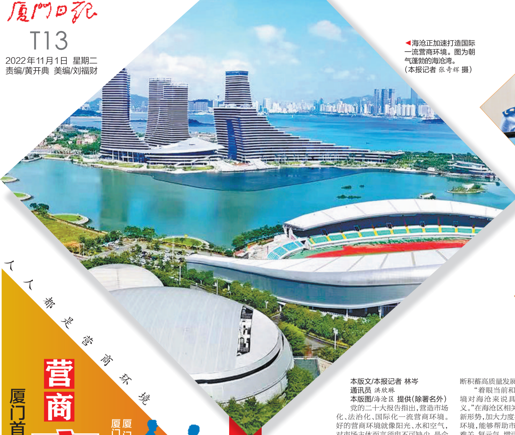
◀海沧正加速打造国际一流营商环境。图为朝气蓬勃的海沧湾。