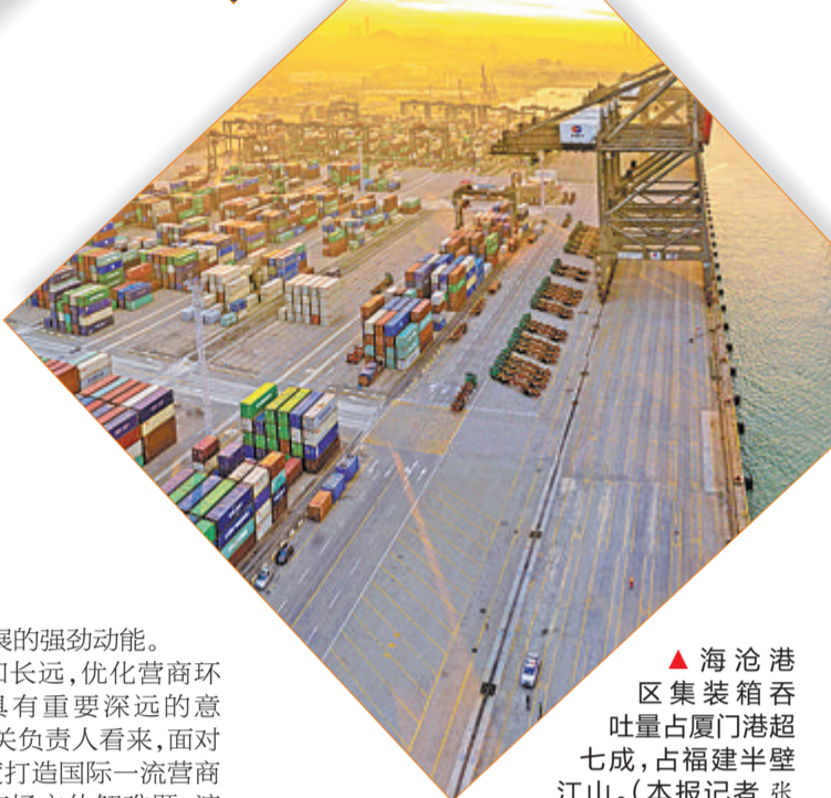
▶海沧港区集装箱吞吐量占厦门港超七成,占福建半壁江山。