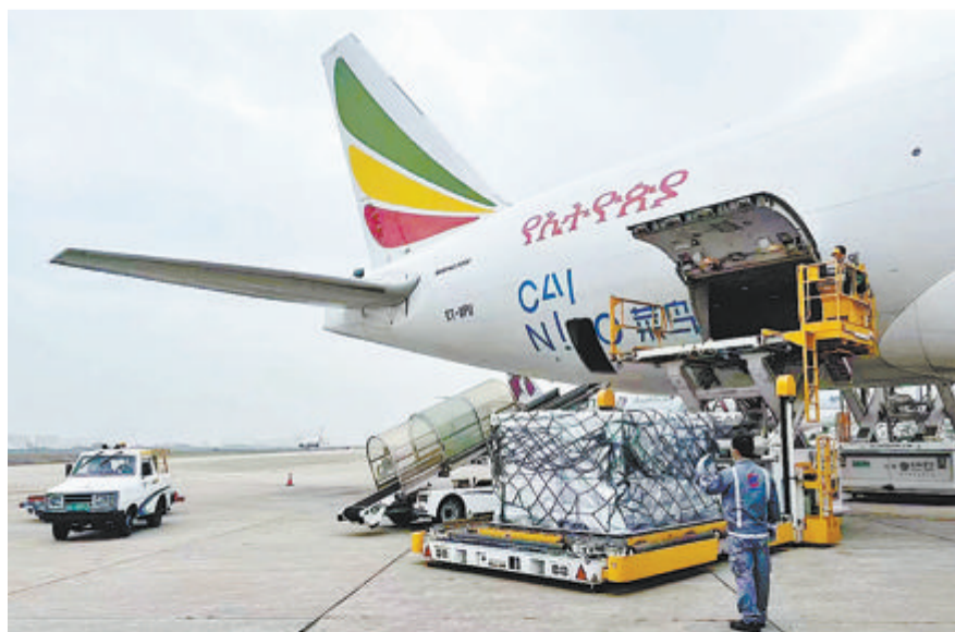
埃塞俄比亚航空ET3743航班首班货机在厦门高崎国际机场进行货物装载。

本报讯（记者 谢嘉迪）昨日，埃塞俄比亚航空ET3743航班搭载近百吨货物从厦门高崎国际机场起飞，前往南美第一大城市圣保罗，执行其全新的厦门往返圣保罗全货运航线。这是自第四届金砖国家新工业革命伙伴关系论坛成功举办后，厦门机场开通的首条巴西全货运航线。